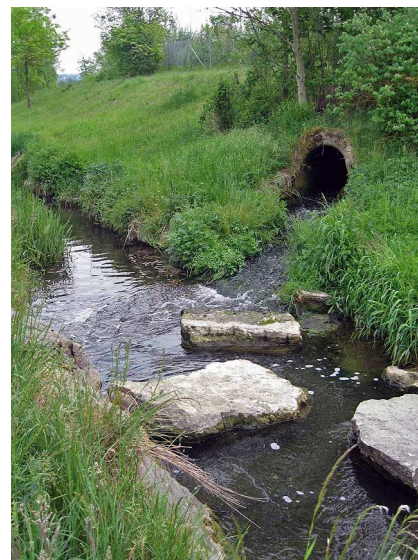
Déversement des eaux épurées dans un cours d'eau: les mesures à mettre en place pour certaines STEP communales doivent réduire l'apport de micropolluants dans les eaux.

Les résultats de la consultation ont été communiqués en détail à la Commission de l'environnement, de l'aménagement du territoire et de l'énergie du Conseil des Etats (CEATE-E). Cette dernière a présenté la motion « Substances en traces dans les eaux usées. Financement de leur élimination selon le principe du pollueur-payeur » (motion 10.3635) qui a été acceptée par le Conseil fédéral et le Conseil des Etats. La seconde chambre, le Conseil national, l'a également acceptée le 15 mars 2011.