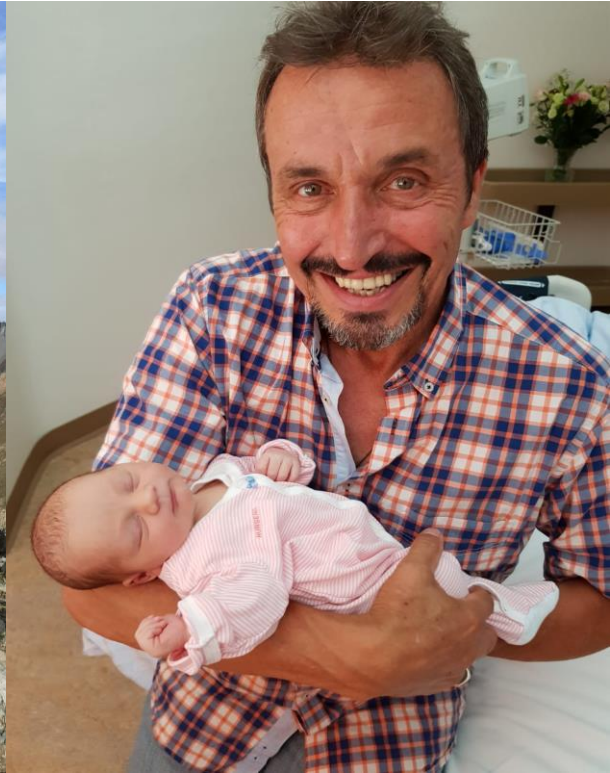
Nouvelle ère de jeune Grand-Père : quel bonheur.