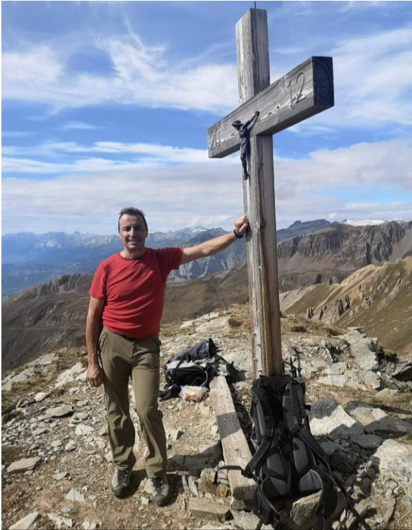
Dans son travail ou en montagne : toujours au sommet

Voilà, j'en termine et je propose à l'assemblée de t'applaudir.